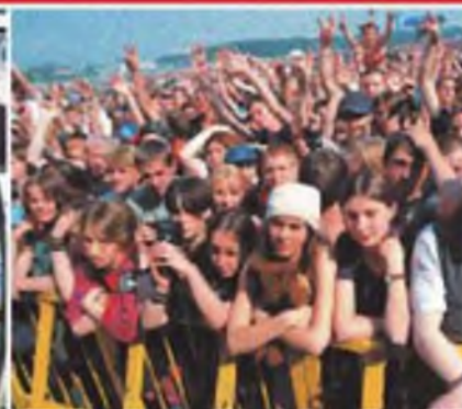
На массовых мероприятиях