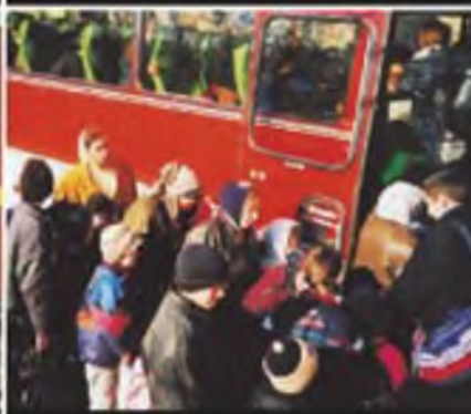
В общественном транспорте