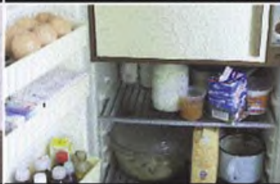
Задерните шторы, приготовьте запас воды и питания