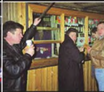
Возле торговой палатки