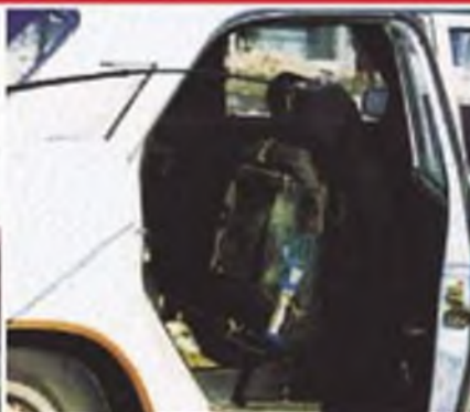
В припаркованной машине