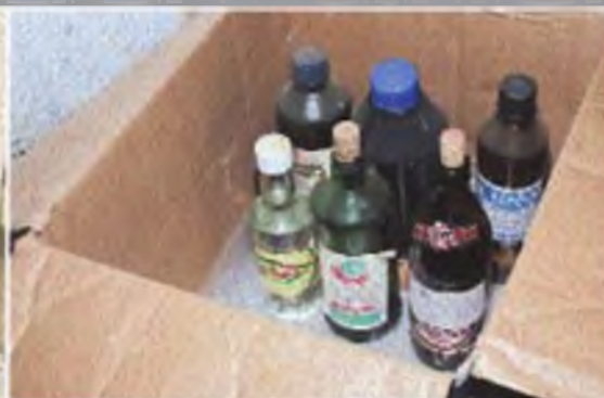
Уберите в безопасное место пожароопасные материалы: краску, бензин, газ в баллонах