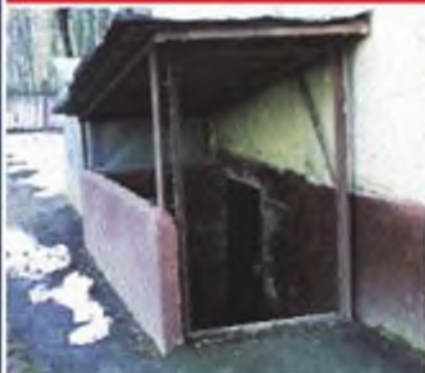
В подвале жилых домов

Взрывное устройство обычно устанавливают: