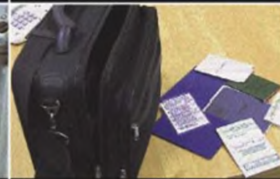
На случай эвакуации сложите в сумку наиболее важные документы, вещи