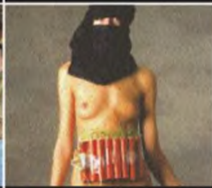
На улице, в парке, в торговом центре