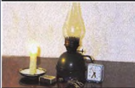
Подготовьте аварийные источники освещения