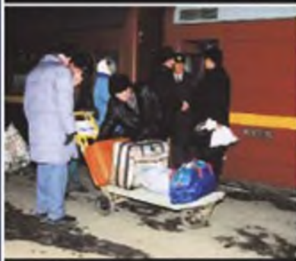
На вокзале, в метро