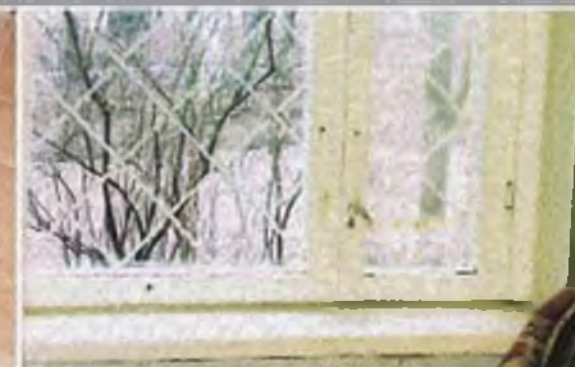
Уберите с окон горшки с цветами и поставьте их на пол