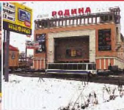
В зрелищных учреждениях