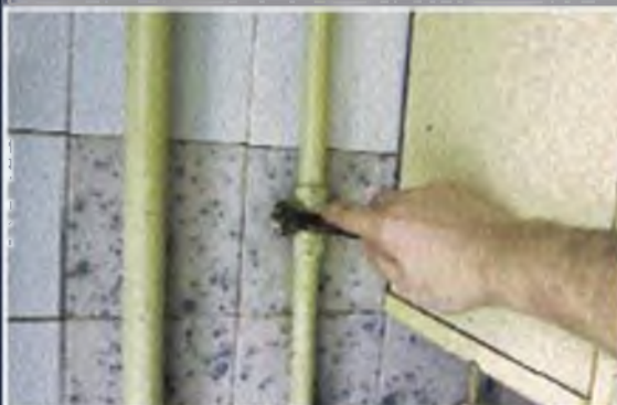
Выключите газ в квартире, потушите огонь в камине

Помните , что если ваши действия будут грамотными и четкими, последствия теракта для вас сведутся к минимуму